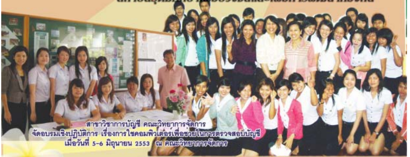
สาขาวิชาการบัญชี คณะวิทยาการจัดการ จัดอบรมเชิงปฏิบัติการ เรื่องการใช้คอมพิวเตอร์เพื่อช่วยในการตรวจสอบบัญชี เมื่อวันที่ 5-6 มิถุนายน 2553 ณ คณะวิทยาการจัดการ

สถาบันอุดมศึกษาเพื่อพัฒนาและเพื่อการพัฒนาท้องถิ่น