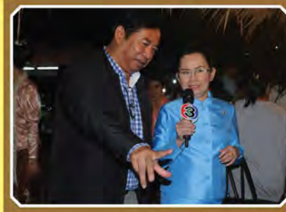
จำอวดหน้าม่าน จากรายการคุณพระช่วย