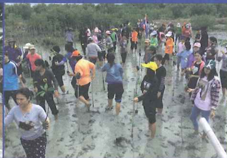
กิจกรรมปลูกป่าชายเลน โครงการอนุรักษ์ป่าชายเลนตามแนวพระราชดำริแหลมผักเบี้ย อ.บ้านแหลม เพชรบุรี วันที่ 8 กรกฎาคม 2557