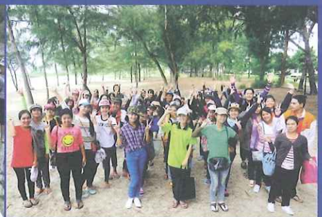
กิจกรรม Walk Rally ณ หาดเจ้าสำราญ เพชรบุรี วันที่ 7 กรกฎาคม 2557