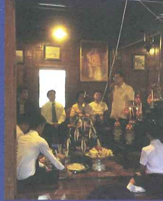
พิธี บายศรีสู่ขวัญ ศาลาเรือนไทย มหาวิทยาลัยราชภัฏเพชรบุรี วันที่ 18 กรกฎาคม 2557

คุณธรรมจริยธรรม “ค่ายธรรมะ เพื่อการพัฒนาสู่ความรุ่งเรือง” ค่ายผลิใบ ณ วัดท่าแพงแดง ต่อดด้วยพิธี “ถวายตัวเป็นศิษย์ ณ อนุสาวรีย์รัชกาลที่ 4 อุทยานประวัติศาสตร์ พระนครคีรี และพิธีบายศรีสู่ขวัญ” เพื่อก้าวสู่ความเป็นส่วนหนึ่งของวิชาชีพการพยาบาลจึงมีความสำคัญ เพราะจะทำให้นักเรียนชั้นมัธยมศึกษาตอนปลายที่ก้าวเข้าสู่การเป็นนักศึกษาพยาบาล ได้มีการเรียนรู้และปรับตัวในการเข้ากับสังคมใหม่ที่ไมคุ้นเคย พร้อมทั้งยังได้ทำความรู้จักกับตนเองและรู้จักกับวิชาชีพพยาบาลด้วย