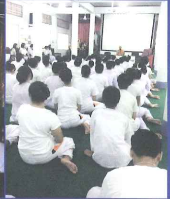
กิจกรรมเข้าค่ายธรรมะ: “ผลิใบ เพื่อการพัฒนาสู่ความรุ่งเรือง” ณ วัดท่าแพงแดง เพชรบุรี วันที่ 10 -13 กรกฎาคม 2557