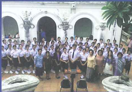
พิธี ถวายตัวเป็นศิษย์ ณ อนุสาวรีย์รัชกาลที่ 4 อุทยานประวัติศาสตร์พระนครคีรี วันที่ 18 กรกฎาคม 2557