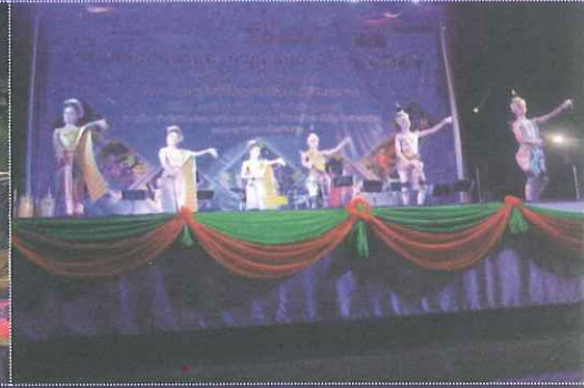
พิธีเปิดงานแสดงดนตรีนาฏศิลป์นานาชาติ ครั้งที่ 5 ในงานราชภัฏกำแพงเพชรวิชาการ ครั้งที่ 11