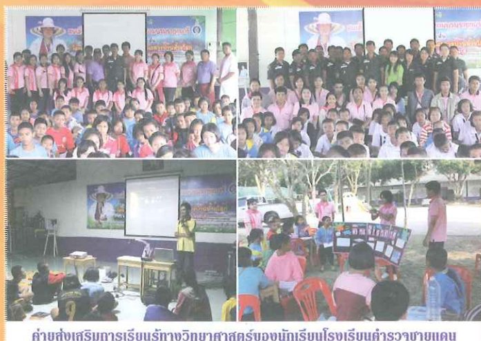
ค่ายส่งเสริมการเรียนรู้ทางวิทยาศาสตร์ของนักเรียนโรงเรียนตำรวจชายตระเวนแดน