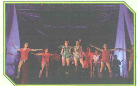
ชุดการแสดงดนตรีลูกทุ่งของมหาวิทยาลัยราชภัฏเพชรบุรี