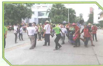
ขบวนแห่งานลานวัฒนธรรม