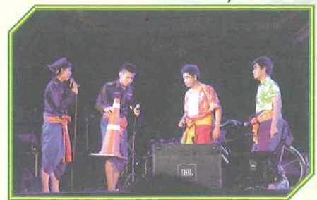
เพลงช้อยของมหาวิทยาลัยราชภัฏกาญจนบุรี