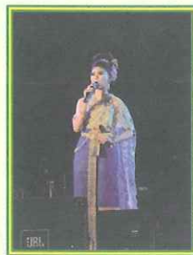
เพลงแหล่ของคณะพยาบาลศาสตร์