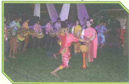
การแสดงกลองยาวของมหาวิทยาลัยราชภัฏนครปฐม