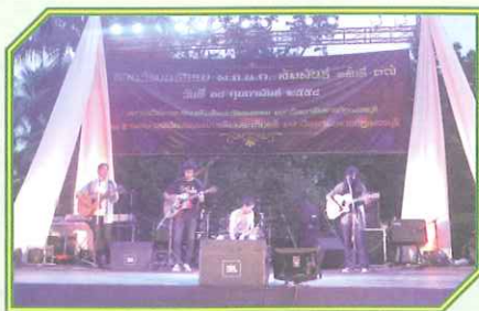
ดนตรีโฟล์คซอง คณะวิทยาการจัดการ