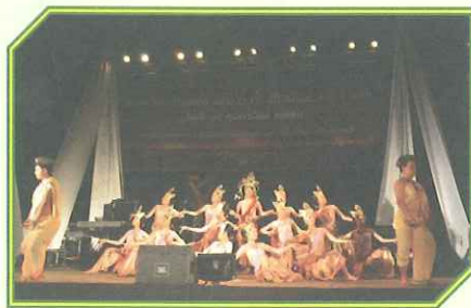
ชุดการแสดง "ระบายปราณคติ วชิระทวารวดี" ของมหาวิทยาลัยราชภัฏเพชรบุรี