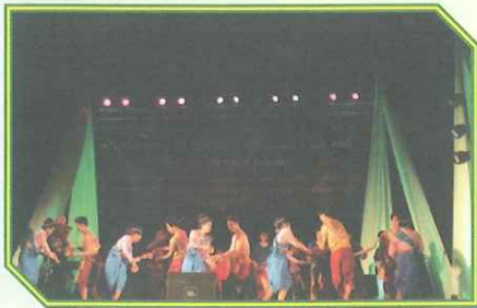
โปงลางของมหาวิทยาลัยราชภัฏหมู่บ้านจอมบึง