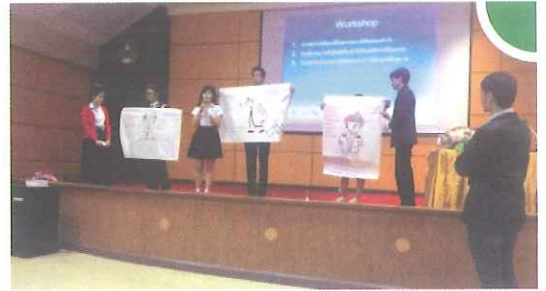
จัดกิจกรรมเพื่อเสริมสร้างความรู้ความเข้าใจให้นักศึกษาอีกด้วย