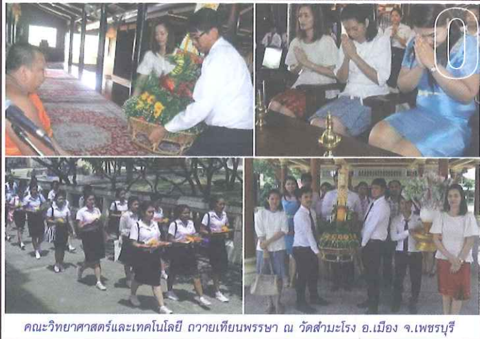
คณะวิทยาศาสตร์และเทคโนโลยี ถวายเทียนพรรษา ณ วัดสำมะโรง อ.เมือง จ.เพชรบุรี