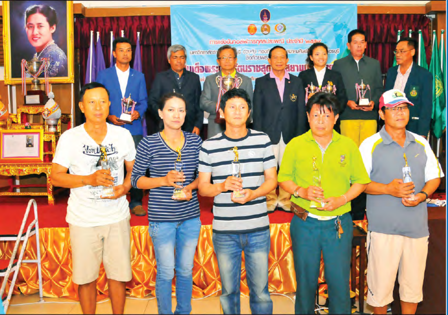
การแข่งขันกอล์ฟการกุศลประเพณีซึ่งด้วยพระราชทาน สมเด็จพระเทพรัตนราชสุดาฯ สยามบรมราชกุมารี เพื่อวันเสาร์ที่ 5 มีนาคม 2559 ณ สนามกอล์ฟศูนย์พัฒนากีฬากองทัพบก สวนสนประดิพัทธ์ จังหวัดประจวบคีรีขันธ์

ปีที่ 38 ฉบับที่ 80 ประจำวันที่ 16 มีนาคม พ.ศ. 2559 www.pbru.ac.th http://news.pbru.ac.th