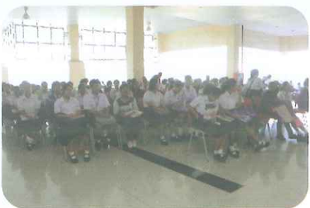
คณะครุศาสตร์ มหาวิทยาลัยราชภัฏเพชรบุรี ได้รับมอบหมายในการจัดสอบสัมภาษณ์นักศึกษาโควตา ประเภทเรียนดี หลักสูตรครุศาสตรบัณฑิต (คบ.) 12 สาขา