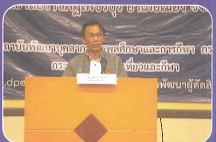
พลศึกษามาเป็นประธานในพิธีเปิด พร้อมกันนี้ได้มอบวุฒิบัตรแก่นักศึกษาและคณาจารย์ผู้เข้าอบรม ณ ห้องประชุมวิทยากริมย์ 2 มหาวิทยาลัยราชภัฏเพชรบุรี