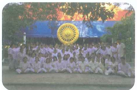
พระบาทสมเด็จพระปรมินทรมหาภูมิพลอดุลยเดช ในระหว่าง วันที่ 24 - 25 ธันวาคม ที่ผ่านมา