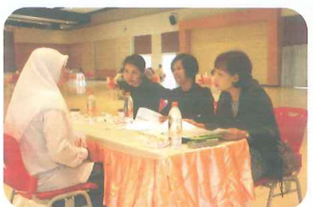
สัมภาษณ์เพื่อเข้าศึกษาต่อในหลักสูตรครุศาสตรบัณฑิต ทุกสาขาวิชาอย่างมาก