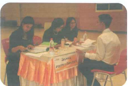
วิชา ณ ห้องประชุมอาคารอเนกประสงค์ 1 มหาวิทยาลัยราชภัฏเพชรบุรี เมื่อวันที่ 18 ธันวาคม 2559 โดยได้รับความสนใจจากนักเรียนชั้นมัธยมศึกษาปีที่ 6 เข้ารับการ