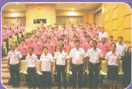
คณะครุศาสตร์ มหาวิทยาลัยราชภัฏเพชรบุรี ร่วมกับ กรมพลศึกษา ได้ดำเนินการจัดโครงการฝึกอบรมผู้ตัดสินกีฬาประเภทกรีฑา แบดมินตัน และฟุตซอล ให้แก่นักศึกษา