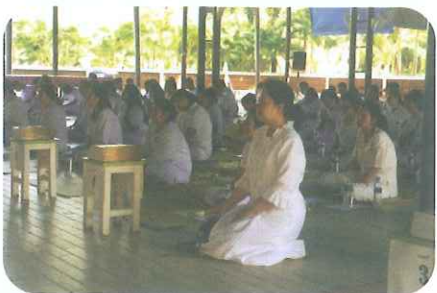
นำนักศึกษาหลักสูตรประกาศนียบัตรบัณฑิตรหัส 59 จำนวน 148 คน ไปเข้าค่ายปฏิบัติธรรม ณ วัดห้วยทรายใต้ อำเภอชะอำ จังหวัดเพชรบุรี เพื่อถวายเป็นพระราชกุศลแด่