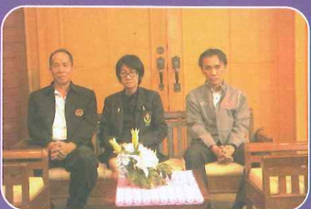
สาขาวิชาพลศึกษา คณาจารย์พลศึกษา และผู้สนใจ ในระหว่างวันที่ 19-23 ธันวาคม 2559 โดย รองศาสตราจารย์ศ. ธีรเดชพงศ์ เป็นประธานในพิธีเปิด และรองอธิการบดีกรม