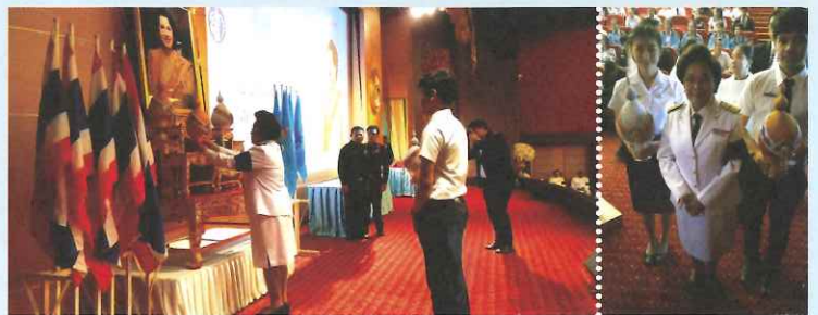
แต่สมเด็จพระนางเจ้าสิริกิติ์ พระบรมราชินีนาถ เนื่องในวันแม่ 12 สิงหาคม พ.ศ. 2560