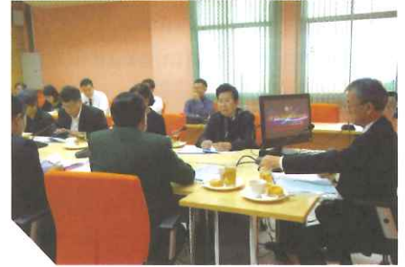
โดยมีบทบาทหน้าที่ประสานการคุ้มครองสิทธิมนุษยชน รวบรวมข้อมูลเพื่อแก้ไขปัญหาสิทธิมนุษยชนในพื้นที่ ส่งเสริมกิจกรรมด้านสิทธิมนุษยชน โดยดำเนินการร่วมกับภาคีเครือข่ายในพื้นที่และสำนักงานคณะกรรมการสิทธิมนุษยชนแห่งชาติ