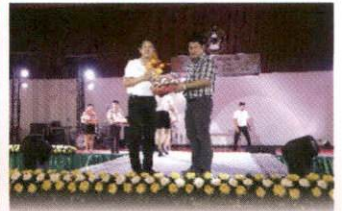
ณ มหาวิทยาลัยราชภัฏกาญจนบุรี