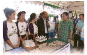
ณ บริเวณชายทะเลหาดเจ้าสำราญ อำเภอเมืองเพชรบุรี จังหวัดเพชรบุรี