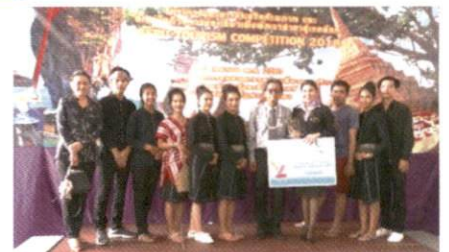
การแข่งขัน SSRU Tourism Competition 2018 เป็นเวทีที่เปิดโอกาสให้นักศึกษาต่าง ๆ ทั่วประเทศที่มีการเปิดการเรียนการสอนด้านการท่องเที่ยวส่งนักศึกษาตัวแทนเข้าร่วมการแข่งขัน จำนวน 30 ทีม เพื่อแสดงศักยภาพในการพากษ์ทัวร์ลีสถานที่ท่องเที่ยวไทย