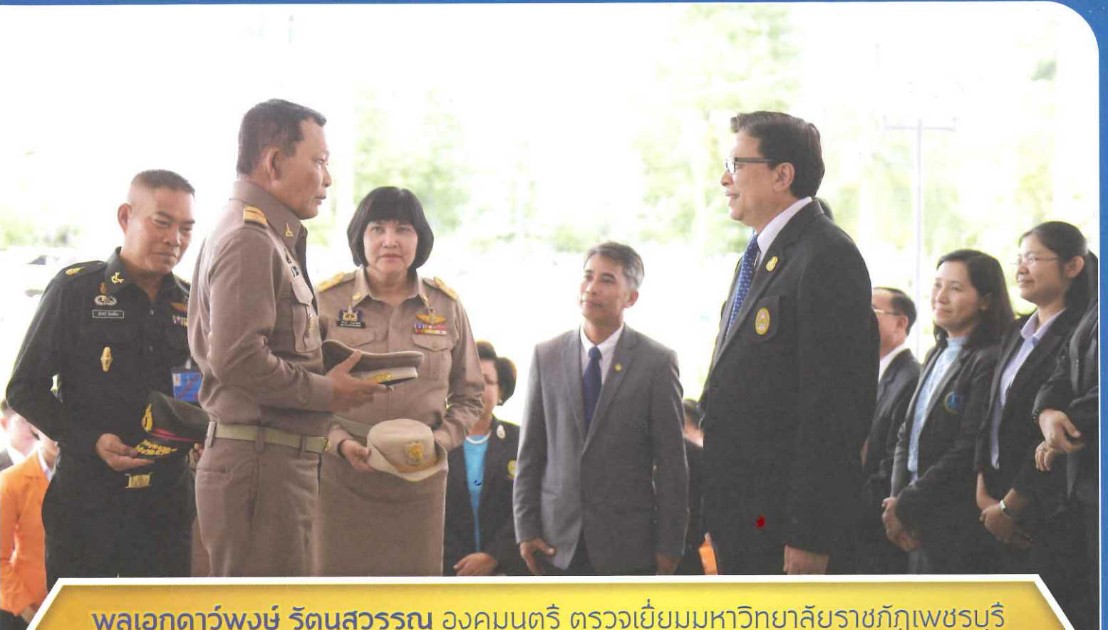
พลเอกดาวพงษ์ รัตนสุวรรณ องคมนตรี ตรวจเยี่ยมมหาวิทยาลัยราชภัฏเพชรบุรี ตามยุทธศาสตร์มหาวิทยาลัยราชภัฏ เพื่อการพัฒนาท้องถิ่นตามพระราชบัญญัติ รัชกาลที่ 10