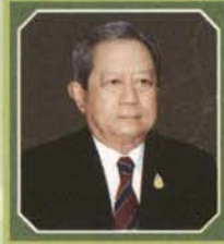
พลเอกสุรยุทธ์ จุลานนท์ นายกสภามหาวิทยาลัยราชภัฏเพชรบุรี