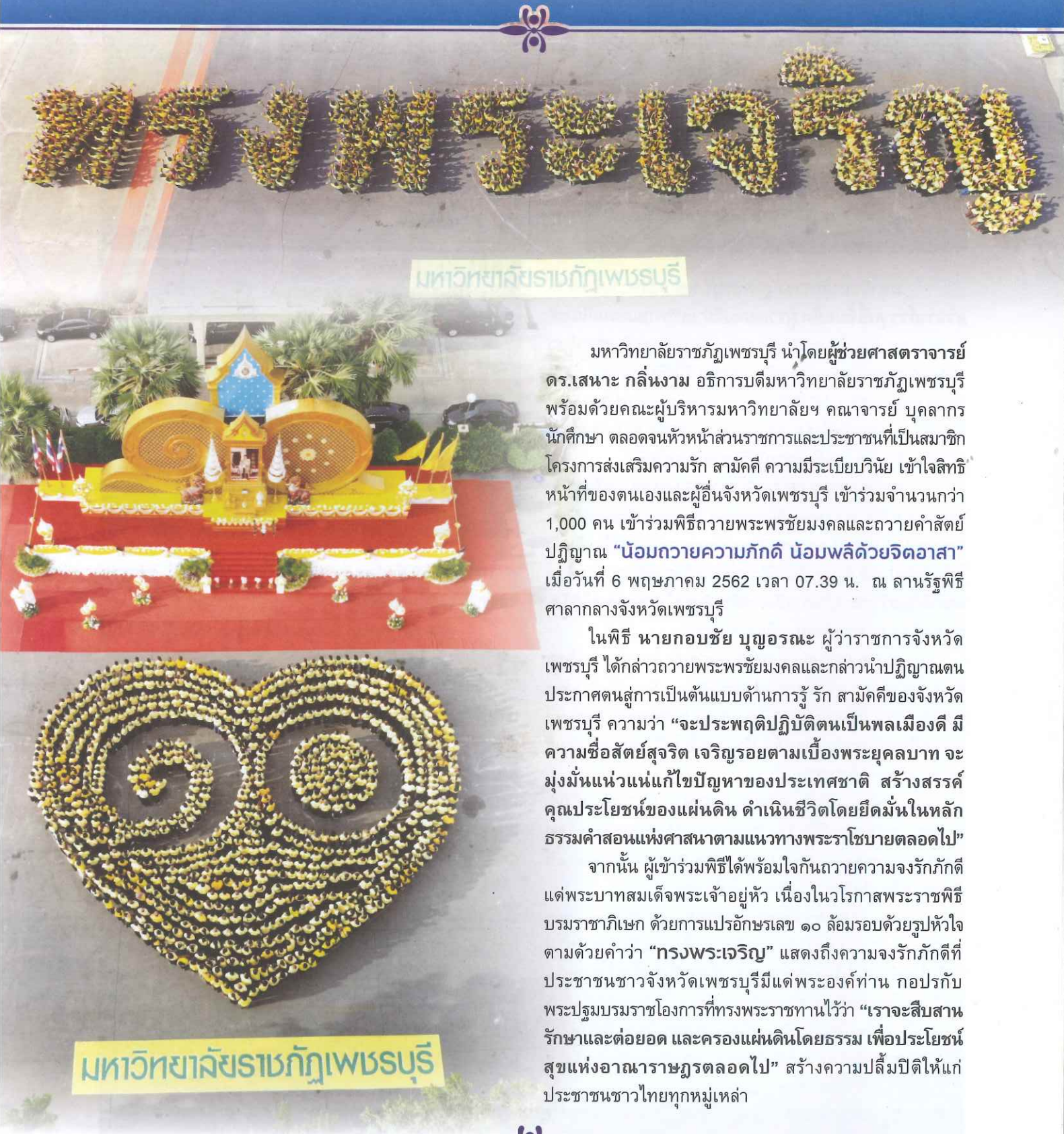
มหาวิทยาลัยราชภัฏเพชรบุรี