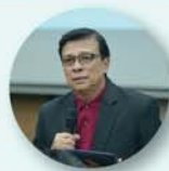
พศ.ดร.เสนาะ กลิ่นงาม อธิการบดีมหาวิทยาลัยราชภัฏเพชรบุรี