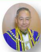
พลอากาศเอก ชลิต พุกผาสุข