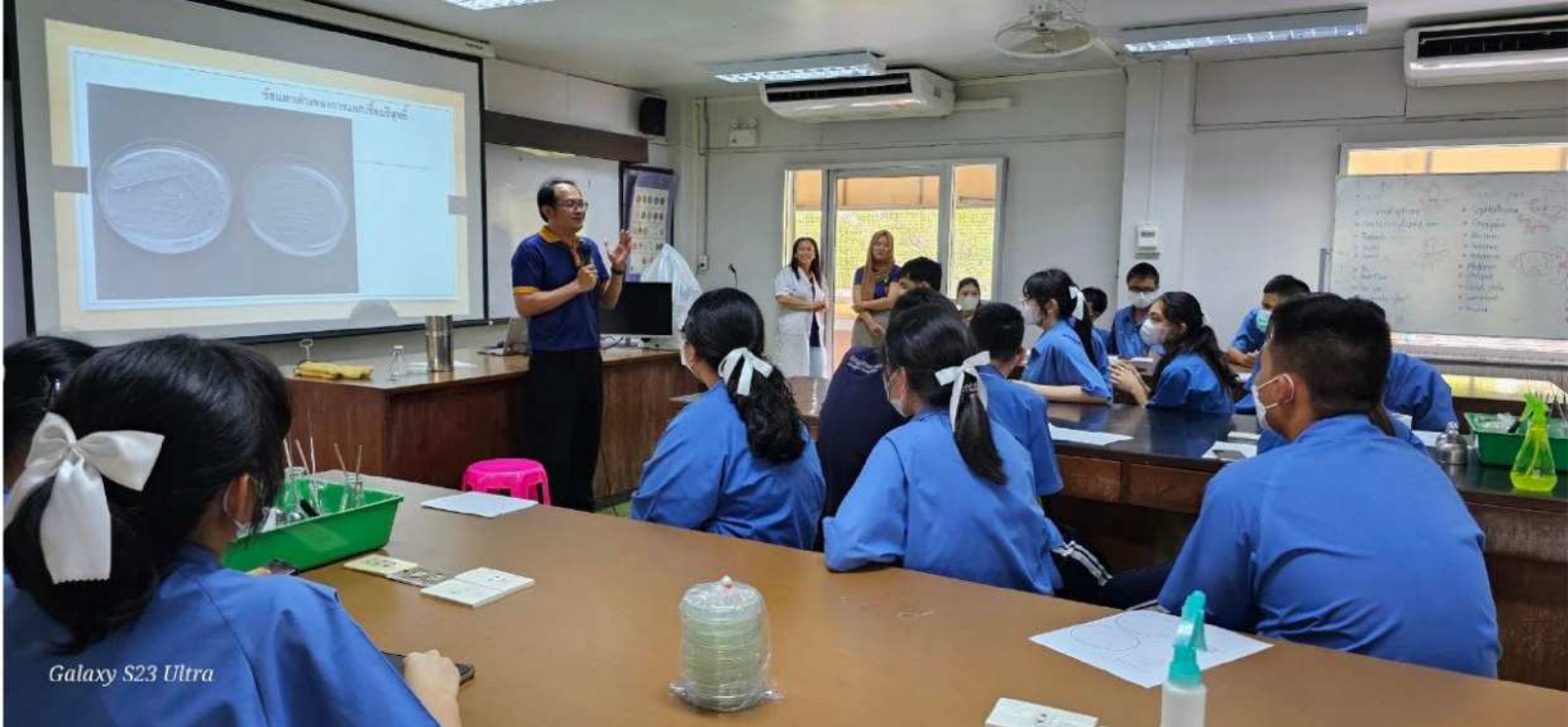
Galaxy S23 Ultra