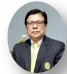
พศ.ดร.เสนาะ กลิ่นงาม อธิการบดีมหาวิทยาลัยราชภัฏเพชรบุรี