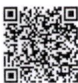
เอกสารเข้าร่วมโครงการ