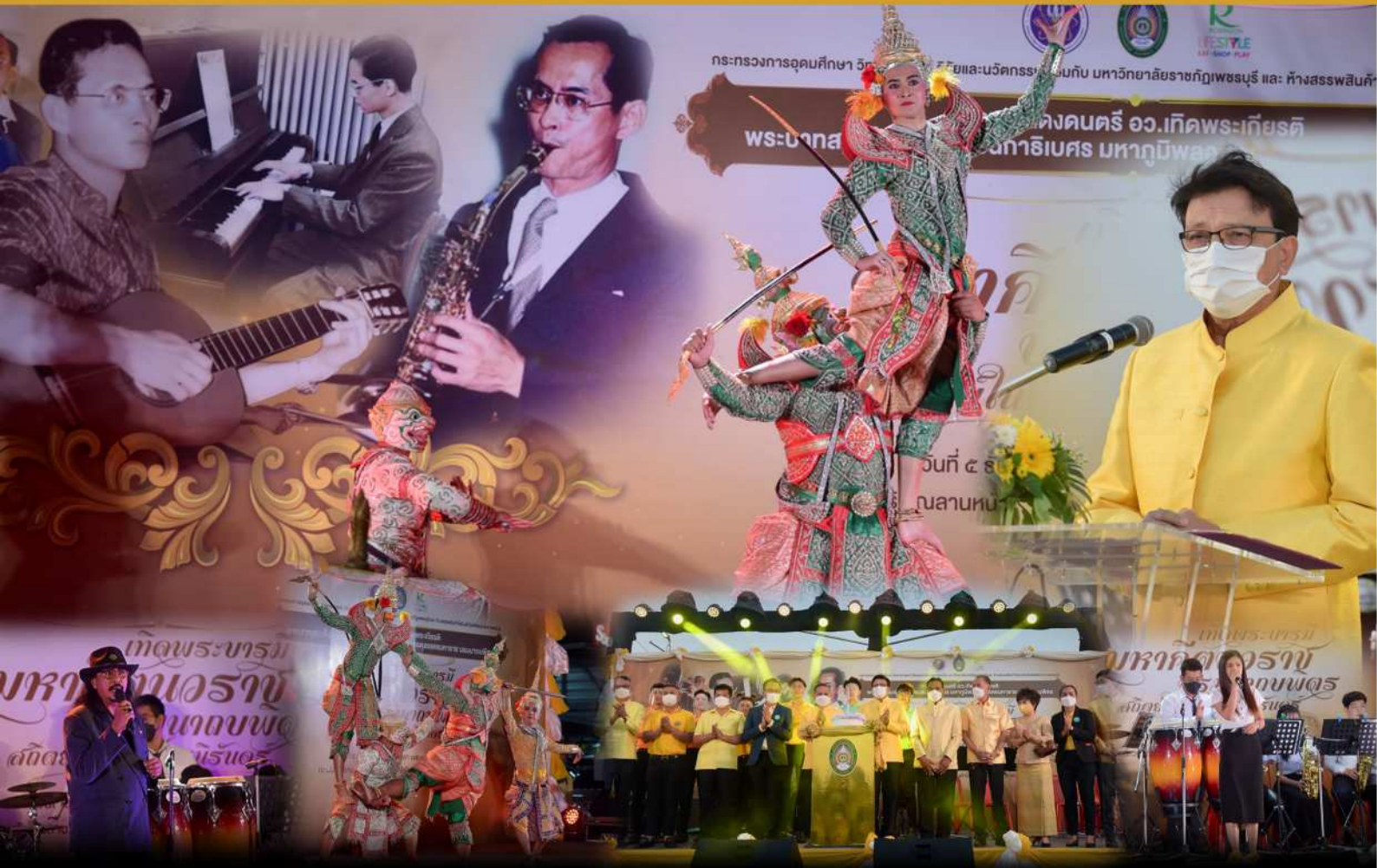
มหาวิทยาลัยราชภัฏเพชรบุรี จัดการแสดงดนตรี อว.เกิดพระเกียรติ ๕ ธันวาคม ๒๕๖๔

DONKHANGYAI DONKHANGYAI DONKHANGYAI DONKHANGYAI DONKHANGYAI DONKHANGYAI